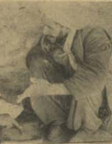
در جوار کتابخانه عامه کتابخانه دیگری وجود دارد که مردم ساده لوح به آن مراجعه نموده از بیعت و از گوز خود سوالهایی میکنند.

در همه کشورهای جهان ممنوع است از این عمل وی نزد پولیس نیویک جرم مشهور تلقی میگردد.