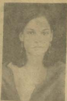
بولیس اینور هپی امریکائی را بعد از اینکه معلوم شد باغزبازانه ازدواج نکرده است عداوت داد از مملکت خارج شود

در همه کشور های جهان ممنوع است از اینرو عمل وی نزد پولیس یک جرم مشهور تلقی میگردد.