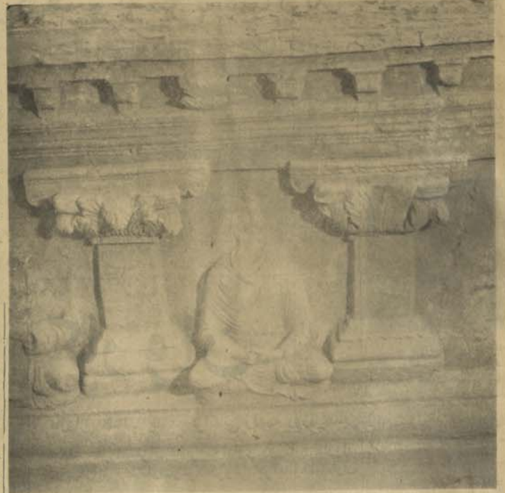
یکی از آثار باستانی که سوآن و سوآن وسط مردم از بین برده شده است

آبدات باستانی افغانستان در خطر انهدام قرار دارند