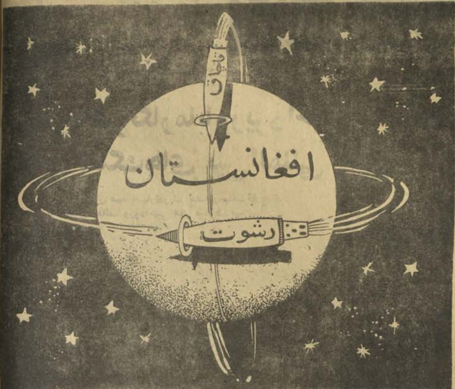
راکت های رشوت و قاچاق در مدار اصلی خود اترار گرفته و مو قفا نهد دو را دور افغانستان در حرکت است.

برای اینکه معاشات اضافه شود (بقیه در صفحه ۳)