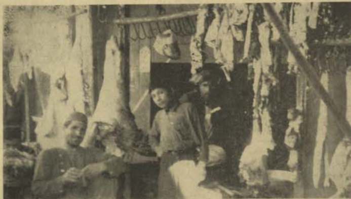
یکی از دکانهای قصابی که گوشت در آن میفروشند. در کنار میزها گوشت های تازه در کاس های فلزی قرار دارد.