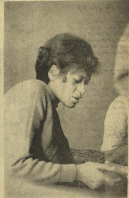
دختر اتمو تیزبانی که در گران هتل کف شناسی میکند از چینی است در هوئل گرا متصل لیسه عا یسه درانی پکتور اندو نیز یالی که در حدود بیست سال عمر دارد مصروف کف شناسی میباشد و از فی نفر ده افغانی اخذ میکند. وی ویفیس سیاح وارد افغانستا نشده و معلوم نیست درین رشته چقدر معلومات دارد.