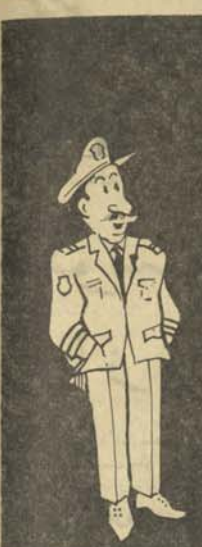
او بچه صلده گفتم که مو تر از خود و یگانه ره بنشان!