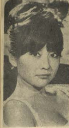
فقط با سه آهنگ خود ش را مشهور

(بقیه صفحه) شرکت سر و پس باید نص کشند یا اتحادیه های انفرادی؟ ولی اتحادیه های انفرادی مواجه خطر یا خساره نمی شود. شرکت سر و پس بیاد دارد که هر قدر مردم کلونه بیشتره و تر خواستند نص خود را غلظ آورده حتی بدادن یک مو تر خا سر نشد. اما اتحادیه های انفرادی مو تر های خود را دران کردن بکار انداخته و درین راه نه نص کشند و نه کسی شکایتی نمود. سند رسمی شرکت سر و پس درین مورد در دسترس ما است. بالاخره اگر آرامی مردم حقیقتا مراد باشند، اینک اتحادیه های انفرادی چیلنج میدهند که حاضرند هر لین را که شرکت سر و پس خواسته باشند در مقابل هم بسو آری به باعث چندین فساد اجتماعی دیگر از قبیل قتل دزدی و جنک می شود. وقت چیزی است که باید همین حالا به از زش آن بی بینم و ترتیبی اتخاذ کنیم که با پول قابل مبالغه شرکت سر و پس با احترام سید محفوظ و نسی اتحادیه انصاف