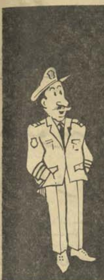
او بچه صلده گفتم که مو تر از خود و بیگانه ره بنشان!