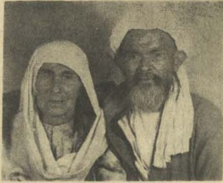
پدر و مادر ما در مینگ محمد

درین اجرا جز یک سلسله شایعاتی صورت گرفته که در ولایت تخاریک ارباب دهقان خود را باقتل رسا نیده است. بفر این دهقان در روز قبل به اردو زو ز نامه کاروان آمده موضوع را به نام نگار ما به این ترتیب شرح داد: