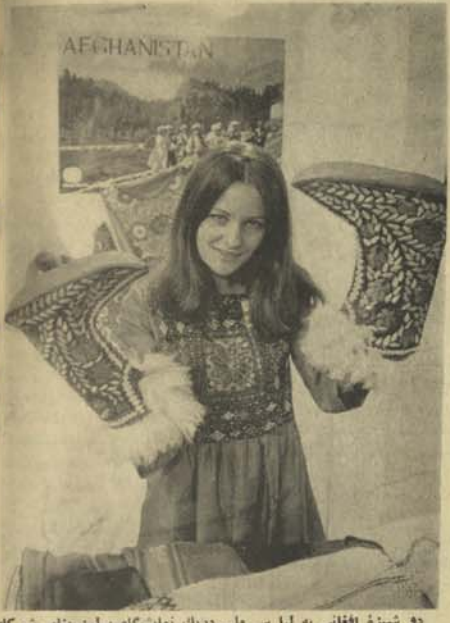
دو شیوه افغانی به لباس ملی دزدک نمایشگاه برلین بنام شوگرانی، در مقابل غرفه افغانستان اسناده قضا با کجوه موزه کلتوری زمستانی را در معرض نمایش قرار داده است. این نماز بنگاه برای ششمین مرتبه به دائر شده بود و تا دیروز ادامه داشت.