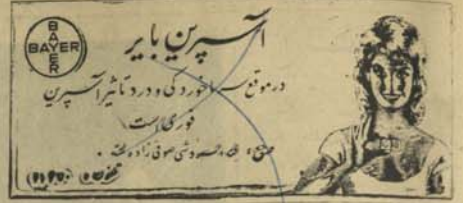
لوهری کال دیار لسمه گنه