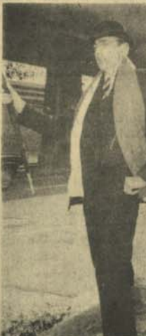
کیت کر چلو

هند شده میگویند که در هند دو هفته را در جیس سیری کرده است. وی درمال هند شده میگویند که در هند دو هفته را در جیس سیری کرده است. وی درمال