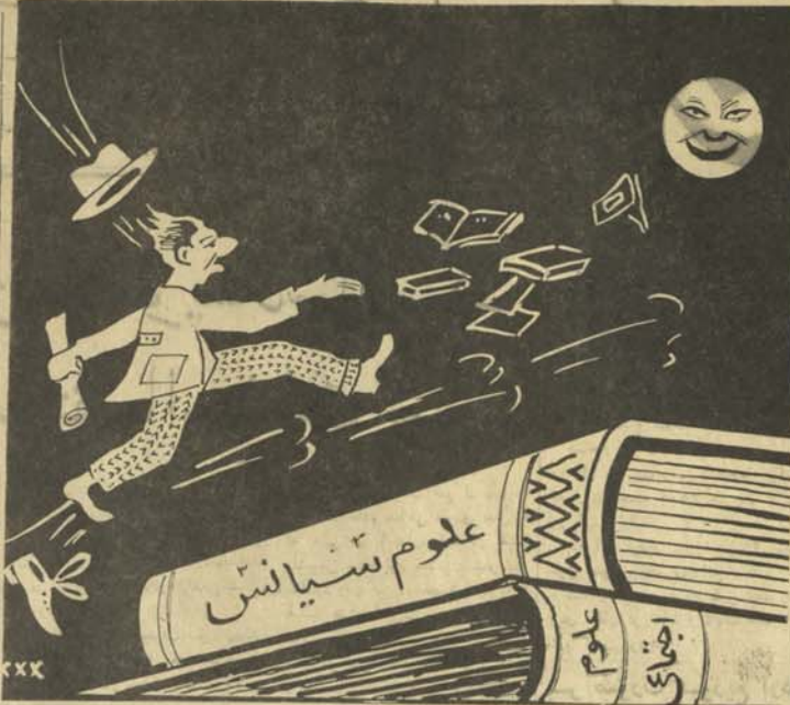
نانم هام بيك خبز ديبلوم گر فيه يك چوكي رهانشال كنم