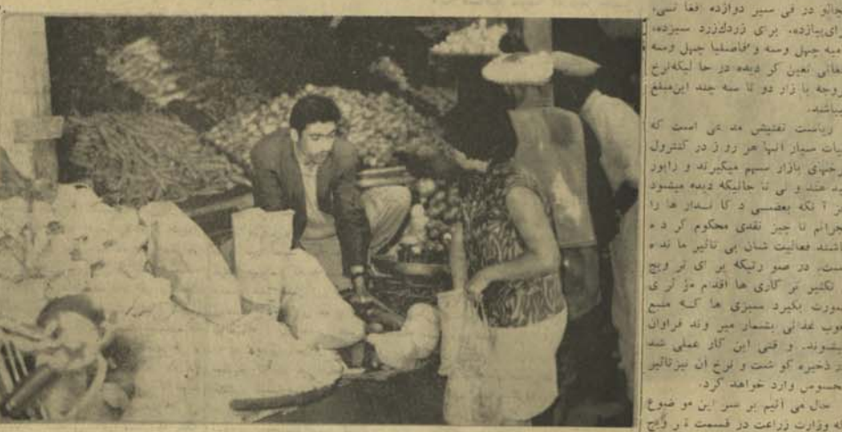
یکی از دکا نیای ترکاری فر و شی شهر که حسب معمول تر خنامه بنار وانی را در نظر نمیگیرند.

در جایی موقع که بهترین و موسم عرضه ترکاری هاست و مردم برای صرف سبزیجات متنوع علاقه نشان میدهند میتوان گفت که بسیاری فروش های شهر مواد زیادی دست تحت کنترل مقامات بنار وانی حفظ الصحه محیطی قرار داده اند. در واقع ترکاری های و قتی سخن از تطبیق و کنترل مؤثر تر خنامهها بعمل آمده شخصی که از ترکاری در کابل با بانک را بیرون بشار وانی است. خود ردن ترکاری های خام در صورتیکه به ترکیب صحیح با ک