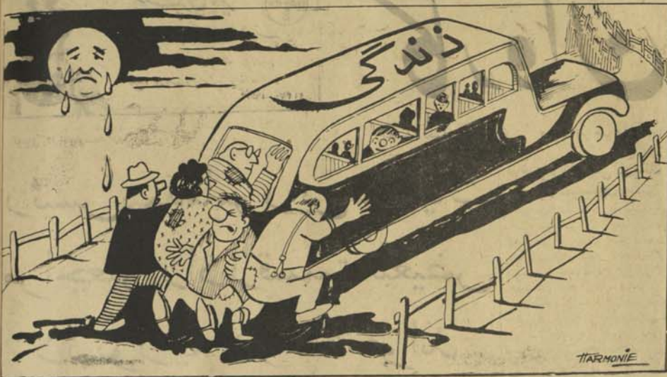
زندگی مردم به این ترتیب میگذرد