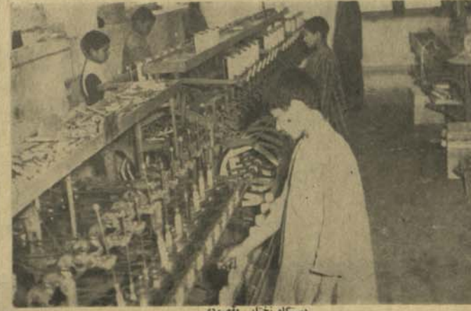
دستگاه نخائی مقصودی

مقصود را تقو به میکنند. هیجان حکو مت ما مراد مود ضرورت خود را از صنایع داخلی بدست می آورند و امید است که از کمک هغه برزاد و لی من وقتیکه دو باره از شیرخان بندر به کابل فرس را در نقاط مختلف رسنیدند انده که فعلا به چند بار بیکه