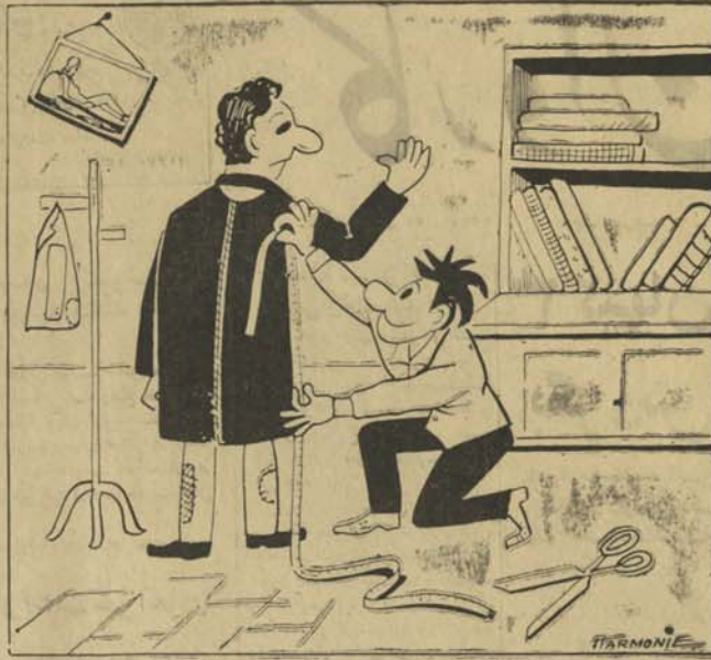
خبا: قربان ای دفعه جیب کلان بران گرفتیم که ده وظیفه جدید دچار مشکلات نشین!