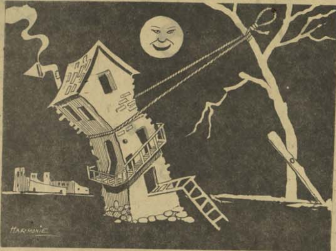
کاری که به اهتس سیرده شود

موضوع سوم بنگار امانت بین بعضی مناطقی است که تا کنون نه شرکت سر ویس و نه بس های انفرادی تمام شکارهای مردم این مناطق را درین راه رفع کرده اند. مسئله چهارم عبارت از قیمت گزاینه فی نفر در بس میباشد. طوریکه خوانندگان این روزنامه مطلع گشته کرده اند اتحادیه انصاف درین مورد شرکت سر ویس را چنانچه دادست که حاضر است قیمت گزاینه فی نفر سواری را ۲۵ پول تقلیل بدهد. و هم رئیس اتحادیه انصاف ولجسی و را در قیمت در آمد هر مو تو د (بقیه در صفحه ۳)