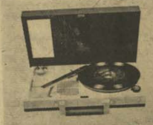
رادیو گرام مدل نی - آر نی ۶۶۶ سی بر قویتری