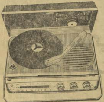
رادیو گراما فون مدل آر-اس ۳۱۰۰ نی-۲۰۰ نی-۱۴۰۰ نی بر قویتری