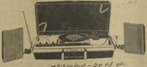
رادیو گراما فون مودل - آر - اس مسای ۳۱۰۰ نی - ۲۰۰۰ نی - ۱۴۰۰ نی بر شوپتری