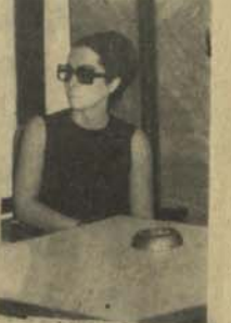
هما بر توی

افسانه که در اروپا نقش خوانده را دارد تحصیل خود را تا درجه دیپلوم در داداشکما لیر آن تکمیل نموده و از ازدواج خود یاد دختر دارد. وی به ترکیه و آلمان و غربی نیز سفر کرده و از زبان های خارجی به انگلیسی تکلم می نماید.