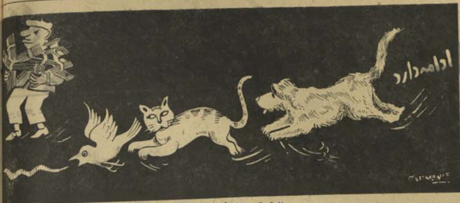
۳۳ شمسه راه طری خات کدم ؟