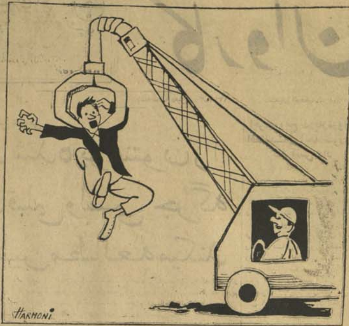
دگام بیگی نفر تیکه دار ده سمت ریکه ات میکنه !!

تاریخ ۱۸ مارچ ۱۹۶۵ دانسته فعالیت خود را در افغانستان پیل نموده و همچنان تحت بیگانه ۱۹۳۰ تکالاف از او به تکیه میزند. نموده خود را بیچنگ قانون نمیداند.