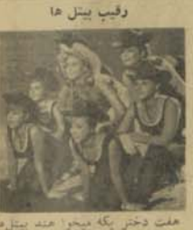
رقیب بیتل ها

هفت دختر بگه میوه اهد بیتل را مغلوب آمانند. هینی برانی سر اینکه خو تر آواز آلمانی که در نغمه ستر ایس شپرت نامی قرار خیرا دست یامایش های مو زنگال زده و به این طریق جلب توجه میباید است. او با شش نفر سراسر پنده و استفاده از اعداد عمیق با بیتل ها بر قایت هنری آغاز نموده و اده کرده است که جیان مو سیه را از وجود بیتل ها پاک خواهد کرد. نمایش هیدی که بصورت تئاتر اجرا موزیکال تهیه شده است. موهای خود را قطع میکند. نام دارد که تصنیف آن یکسره اتفاق بر او صاع وحوال و هنر بیتل ها میباشند. مصراوات میگویند اگر این حرکت ناشی از یک عوس ز را نه باشد یا عکس العمل علیه بیتل ها، در هر دو صورت نهایتاً تکلیف می وجود دارد که آن تازگی و کیفیت جزیبه نمایش های موزیکال است. دیکر غالب و مغلوب این بیتل ها و رقیب آنها ششان جیدان قابل توجه نمی باشد.