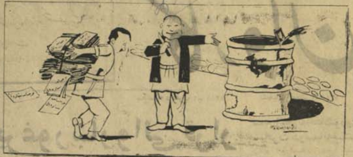
او بجه صدقه‌گفتیم با غلای با طره‌ه اینجه بنداز!

بیا آید من با شما یکجا جنو کاروان را گرفته می‌بریم. اینجا سید منگ است و این سر و پهلوی خالی که یکجا آری میشماریم. اینک دوازده موتر است. برای همه منظور اینجا تو قف دارند. برای اینکه لویت این‌ها بر شای برسد و به شهر بروند. این موترها یک سرک با لا تر نمی‌روند و بر عکس ببینید که این موتر از یک سرک بالا تر می‌رود یعنی نورمحمد شاه مینه آمده و بیش از بیست نفر در پا‌های موتر خود را کشال کرده‌اند. آیا مجبور میشنید جناب خود را باطلر مواجه‌ها رفته‌اند؟ ایس و حیثیت خود بگذرند. برای چه برای اینکه اگر بو قف حاشیری (بقیه در صفحه ۴)