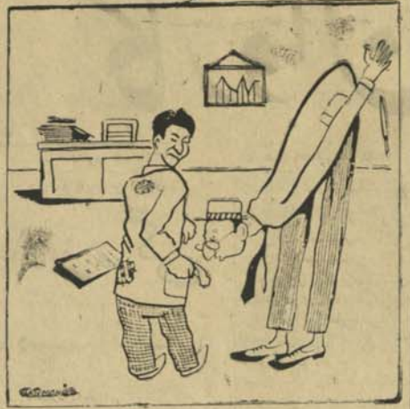
تو باش که ده قاضی ت اصولا نوشته شده