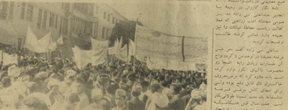
صحنه از مظاہرات در روز مخصلان بو هنتون کابل در جا د هیوند

نیو یارک ۴ میزان مجمع عمومی مو مسئله ملل متحد در شب بایک اکثریت خیلی بر رگ فیصله نامه کشورهای آسمیانی و افریقانی را در باره رودیشیا به تصویب رسانید. درین فیصله نامه از انگلستان تقاضا شده تا به هیچ صورت حاضر نگردد به رودیشیا قبل از اینکه در آن منطقه یک حکومت اکثریت روئکار آید ، آزادی اعطاء نماید. نماینده انگلستان قبل از اینکه مجمع عمومی را جمع به فیصله نامه کشورهای آسیایی و افریقانی رای بدهد گفت حکومت وی طوریکه از بیانیه های ضد راعظم آکستور اخیرا در بلقان واقع گزیده حاضر نیست قبل از ظهور یک حکومت اکثریت در رودیشیا با آزادی آن موافقت نشان بدهد. فیصله نامه مجمع عمومی ملل متحد به تعقیب مقرراتی است که در گذشته که بین عراق و لبنان و بین صده راعظم انگلستان و بیانیه شصت صد راعظم حکومت قانونی رودیشیا بر عرشه یک کشنی اکیسیتی در جبل الطارق صورت گرفت. به تعقیب مقررات کرات شامع گردید که شاید انگلستان در صورت نیکه حکومت سیمت منهدم شود با لخره یک حکومت اکثریت را در رودیشیا میسازد آورد. سه آزادی رودیشیا موافقت نشان بدهد.