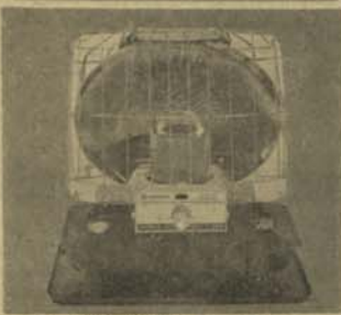
بخاری اتو ما تیک تیل خاکی نشنل