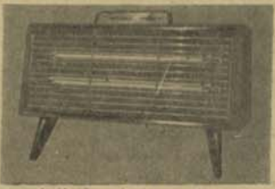
بخاری اتو ما تیک برقی نشنل