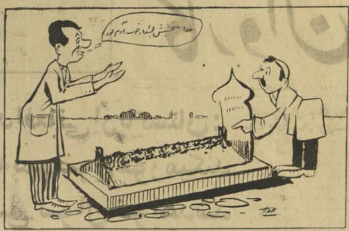
تفر مقابل: تا دیروز خو تک و تراویش میکنی !!

دامتاز خوانده : صباح الدین کشکی مسئول مدیر : عبدالحق واله کاتبی اشترک : به کابل کتبی ۳۰۰ افغانی به ولایات کتبی : ۳۵۰ دیوبی گمبیه : ۱۷۵۰ - دالر بته : دصدرات خلود لاری کابل، افغانستان تلفون : ۲۱۰۴۹ (بقیه در صفحه ۴)