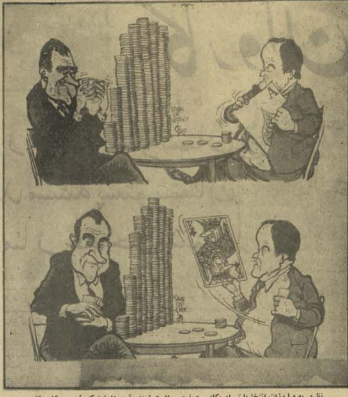
نظری به میا وزات آنها با تی امریکا: هملری- او هو! ما یقین داریم که طوس میکنم !!

اشخاصی تخیله ما کسائی اند که در دستنه های مختلف دولت کار میکنند. اگر ایشان علیه بکنون خود و ناتیکنه در امور دولتی اشتغال ندارند. به تدریگ یکا و دسیاسی بیرون دارند. عا به دولت را که پیش خواهد برد ؟