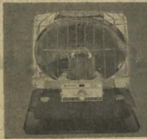
بخاری اتو ما تیک تیل خاکی نشنل