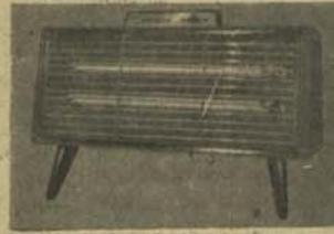
بخاری اتو ما تیک برقی نشنل