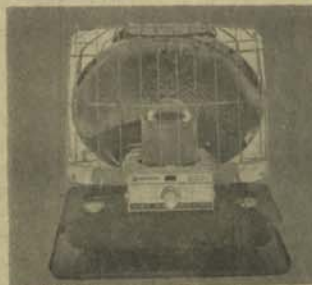
بخاری اتو ما تیک تیل خاکی نشنل