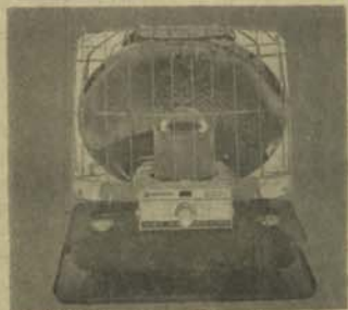
بخاری اتو ما تیک تیل خاکی نشنل