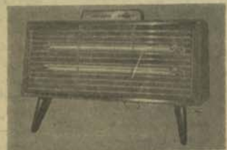
بخاری اتو ما تیک برقی نشنل