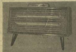
بخاری اتو ما تیک برقی نشنل