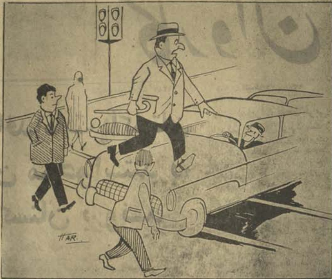
نو که سر خط بیاده و استاد کتی مام مجبور هستیم که از سر نو طرف سرک تیرشوم

در اخیر از شمع وریزه قوماندانی امنیه ولایت کابل و وزارت داخله خوا هستندم در مورد اعطای وریزه اقامت به خارجیان فکر کنند که اگر یک خارجی از استحقاق خود در اینجا یکسال بیشتر ماند به روزی یک (بقیه در صفحه ۳)