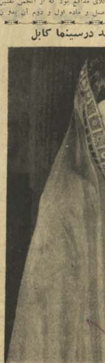
چالترین کسرت و سبقی به اشتراک حمیده و زبیری معروف به رخصانه، ناهید، ناولک استاد محترم، سر مست و دیگر چیره های ممتاز هنری در سنهای کابل اجرا میگردند. تکتیا از ساعت نه صبح تا شش وعده ناهید در غر های سنیتما کابل بفرش می رسد. وقت ناهید: ساعت هفت و نیم شام

که در این مدت از ایشان معرا می و متابعت نموده بودند تشکر نموده، عه ستار شدند. سر از روز ۲۸ عرب حاضر گردند. در ختم اعلامیه چنین افزو شد «اگر در و ما امرین و معلمین محصلین را نظر به بعضی ملحوظات از قبیل غیر حاضری و غیره از امتحان محروم سازند، باز هم بر این شان قدم علم خواهد نمود. جشن بو هنتون ساعت ۱۰:۳۰ پایان رسید.