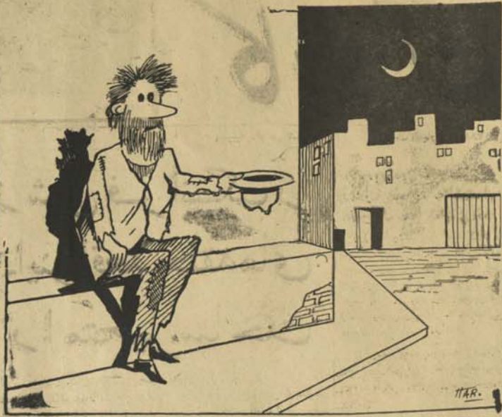
بنام توریست داخل شمار میشین، بهای شکل گمانی میکنن و به ای تر تیب سفر خوده ادامه میتن...

اگر طرز نگارش و آموختن آن از شرایط ما دوری باشد، بسما امکان ندارد در طرف یکسال سوسه کار عدنان ما بجای برسد که مطالب را بتواند بی با خود خالص و واضح نوشته ما نند امروز ما سوسه و فت قیمتار خود و وقت قیمتار سر و زوران ما را ضایع نسازند. این موضوع در ظاهر هر عسادی مینماید و شاید به نظر بعضی اشخاص به این نیز زد که سرهفاله به آن وقت گردد اما در حقیقت برای سرعت کار و بهبود احوال و اهمیت حیاتی دارد.