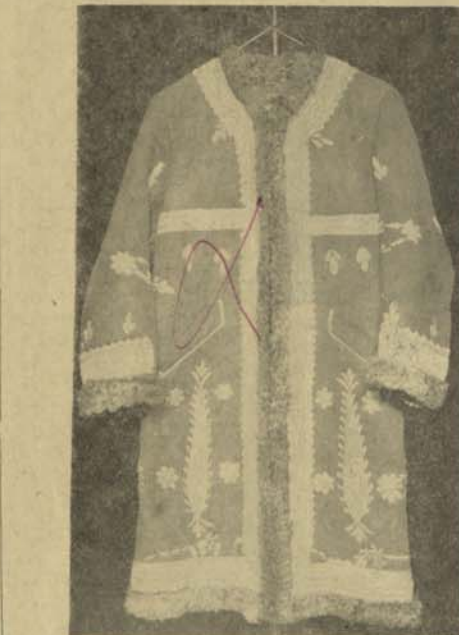
این پوستین نوع نو از تولیدات نورد زاده شرکت میباشد. خانها و اقا بان با سلیقه داخلی و خارجی از این لباس دو دو هم سر استفاده میکنند. مرغ فروش: نورد زاده کمپنت شرکت چادر راهی صادرات.

لانی کار طبع فر آن کسر بیم که بی سابقه بود در طبعه وطن عزیز آغاز گردید. از طرف دیگر چون در کابینه محمد هاشم خان صدراعظم اکثر افراد با تجربه و اهل کار بودند به آبادی مملکت، گرد آ و ردن پول بزی خزانه و واریسی امور حکومت کار میکردند تا اینکه عبدالحمید خان وایلی بانک ملی را تا سیس نمود وزیر نظر او شرکت های تجاری با نظم و ترتیب افتتاح شد. با بانک شاهی بوجود آمد و به اعتبار آن نوبت طبع شد یعنی پول کافی که در مملکت رایج نبود بدو ران چنده افتاد. درین وقت فابریکه های آلیز تا سیس گردید. حجم تجارت دو چند شد. از طرف دیگر کار سرگ مراد شریف رویه منت کسر نه شد. درانوقت تراکتور و سیمان امروزی موجود (بقیه در صفحه ۴)