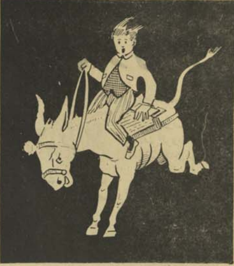
ده سر و نس خو جای تیس پستراس کهده ای و سیله خوده به مکتب بر سادم