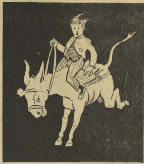
ده سر و نس خو جای نیس بتراس که ره ای و سیله خوده به مکتب بر سنام