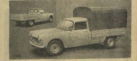
بک اب پوژو

از این موتور ها در مسابقات بین المللی و در دوانی که مسابقات کنندگان غریب از افغانستان هم عبور میکنند نیز استفاده میشود. موتور های پوژو در نمایش های بین المللی از پنج سال به اینطرف حازر در جه اول میگرددند. موتور پوژو بخرید و بسحا طر آسوده بهدشوار ترین راه ها بروید و به تمام اطراف مملکت سیر و سیاحت بکنید. مطمئن باشید که کمترین نراحتی احساس نخواهید کرد و با کمترین متنگی بر نخواهید خورد. این حقیقت به تجر به تا بتندمدست زیرا کسانیکه یکبار پوژو سوار شده اند باز هرگز بفرسودگی موتور دیگری نیفتادند. آرامی و راحت پوژو را میتوانست که در موتور های دیگری بیاید. کمیته معروف پوژو علاوه بر موتور های سواری (تیز رفتار) و ترهای مکروس و موتور های باربری (سک ا ب) از قبیل (سک ا ب) و (لاگون) که برای حمل و نقل اموال خیلی مساعده است نیز تولید میکنند. به پوژو اعتماد کنید. پوژو بخرید و یک عمر راحت باشید. نمایندگی پوژو به تمام قدر متعقد شد و م بیشتر بان خود را گرامی دارد و آرزو مند است که از نا جیه سر و سر و سیم و دانستن روابط حسنه با مشتری بان بی معنا باشد. به آدرس نوجه فرمائید: شیون سبامی شرکت، کیلانی بلدنگ مقابل بوسته خانه شهر نو، کابل.