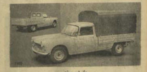
بک اب پوژو

از این موتور ها در مسابقات بین المللی و تر دوایی که مسابقات کنندگان غریب از افغانستان هم عبور میکنند نیز استفاده میشود. موتور های پوژو در نمایش های بین المللی از پنج سال به اینطرف حازر در جه اول میگرددند. موتور پوژو بخرید و بسخا طر مسافرتی درین راه ها بروید و به تمام اطراف مملکت مسو و سیاحت نمایند. مطمئن باشید که کمترین ناراحتی احساس نخواهید کرد و با کمترین مشکلی بر نخواهید خورد. این حقیقت به تجر به تا بتندست زیرا کسانیکه یکبار پوژو سوار شده اند باز هرگز بفرسودگی موتور دیگری نیفتاده اند. آرامی و راحت پوژو را میگویند که در موتور های دیگری بیاید. کمیتی معروف پوژو علاوه بر موتور های سواری (تیز رفتار) مو ترهای مگروس و مو تر های باربری (بک اب) از قبیل (بک اب) و (لاگون) که برای حمل و نقل اموال خیلی مساعده است نیز تولید میکنند. به پوژو اعتماد کنید. پوژو بخرید و راحت باشید. نمایندگی پوژو به تمام قدر و تمیکند و م بیشتر بان خود را گرامی دارد و آرزو مند است که از نا حیسه سر و سر و سیم و دانستن روابط حسنه با مشتری بان بی معنا باشد. به آدرس نوجه فر ما نید: شیون سبامی شرکت، کیلانی بلدنگ مقابل بوسته خانه شهر نو، کابل.