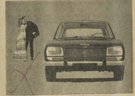
تیز رفتار پوژو