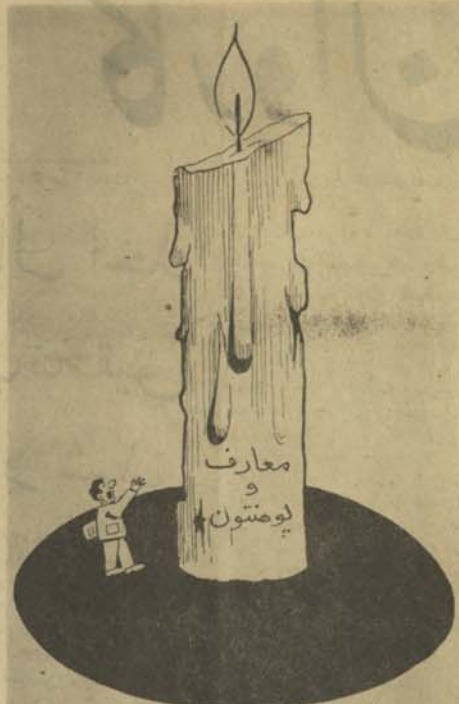
دو هفته شد كه اي شمع سر خود بسوزده بدون ايكه كس بگلش توجه كنه خذاكند كدام باد شديده از كدام طرف برف نكته

سبحر بيوي انسيتم نيز در خانم مريم اگر افان جدا مشب فراق تا مبحرم چو بگذري قدمي بر در چشمن بنگار قياسي گني كه تمت از شما رجا ك دم بگشت غمخو غر نسر بر تو نمراميدان من از خيال ليرا جدا لغزات زنده ترم گرفت غر صبا عالم جمال طمع دوست بيهر كجا كه و مران جمال ميستگرم بر غم فلسفيان ز بشنو ان دقيقه من. كه غايي تو و هر غم غر فتي از نظرم اگر تو دعوي معجز عيان بخواهي گورد. يكي ز نرمت من بر كز جود و كز م كه سر ز خاك بر ازم جو شمع ديگر ياز. به پيشرو ي تو بر او نه و ارجان سيزم مرا اگر بچنين شور بيهر نديجك درون خاك ز شو ر درون گفن به دم بد ن صفت كه بپوچ ان درون بود كشتي همي رود تن زارم در آب چشم نسر م چنان نيفتم در سينه دار لاله و خسي كه شد جو نجه ليا نيز خود دل جو چرم