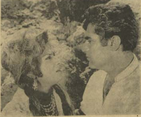
شعله های خشم : محل نمایش سینمای آریانا

فلم شعله های خشم از نگاه رنگ آمیزی . آهنگهای پس منظرس و (تأخردوی هم) فلمبرداری و جنبه انتباهی آن خوب است . ولی از لحاظ دایرکت و تمثیل نمیتوان آنرا درجمله فلماهای موفق حساب کرد .