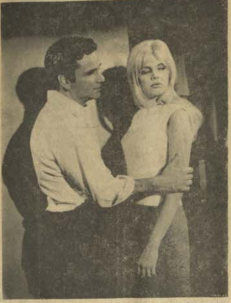
این همه درد: در حال نمایش در سینما پارک