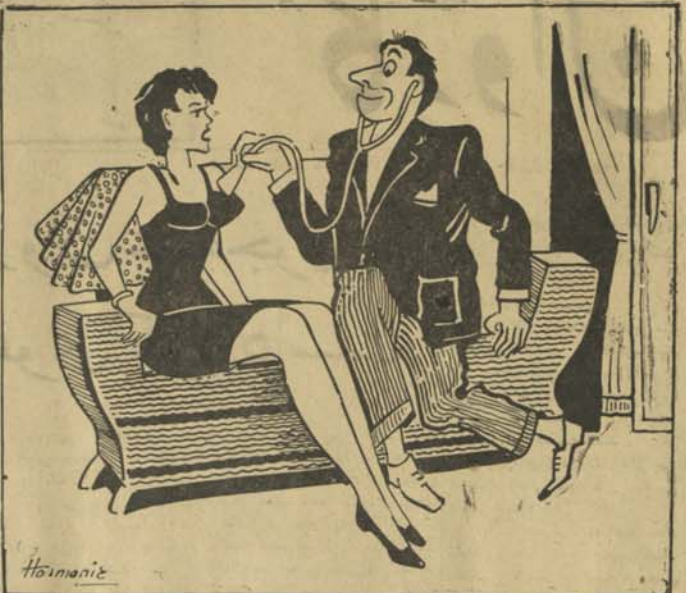
مرفین: دکتر صاحب هه هروخت انکسی زوب می یوشم. فشارم به ۱۸۰ بالا میره. داکتر: یس بسپتر اس همه منتهی زوب بیوشم تا فشار دیگرها از دین شما به پنجصد برسه.

در خانه یکبار دیگر به خوانندگان خود اطمینان بیدار می کند ما این روزنامه را برای پیشبرد مسافه شخصی خود تأسیس نکرده ایم و از جمله بر اشخاص جدا احترام نمیکند.