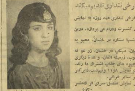
فرخی تنداوی تقدیم میگردد فرخی تنداوی همه روزه به نمایش های کسرت و دوام می پردازد. دین نمایشها ستاره در خشان، محبوبه خشان، مراتب در خشان، زر غوثه محبوب، زمینه افغان، و عده دیگری از جیره های جذاب اشتراک دارند. وقت نمایش ۱۱:۳۰ و نیمه شب. دایرکتور بنابر سایر هرانی. محل نمایش متصل سرای فرقیه شهر ۳۰ ستاره درخشان هنر مند فرخی تنداوی مطبوعه دولتی

روز ناه. کاروان که هنر مند انانگت شهادر کسور را مستحق هر گونه قدر دانی و پشتیبانی میماند و اوله این سرک مقبول و جاق و چله را به زیلا و شوهرش تبریک میگوید برای هنر متان روز های خوش و بی دغله میخواهد تا در آن نتوانند هنر خوش را انکشاف داده زمینه اتلاذ روحی مردم خود را فراهم آورند.