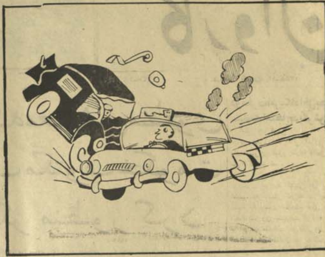
نامینوا نیدرسرگها از نزدیکی با مو تر های تنکی خود داری کتند. زیر آنها از مقررات توافقیه معاف اند.