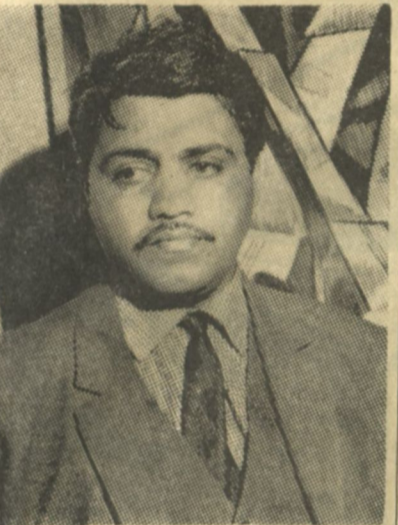
سید مقدس نگاه