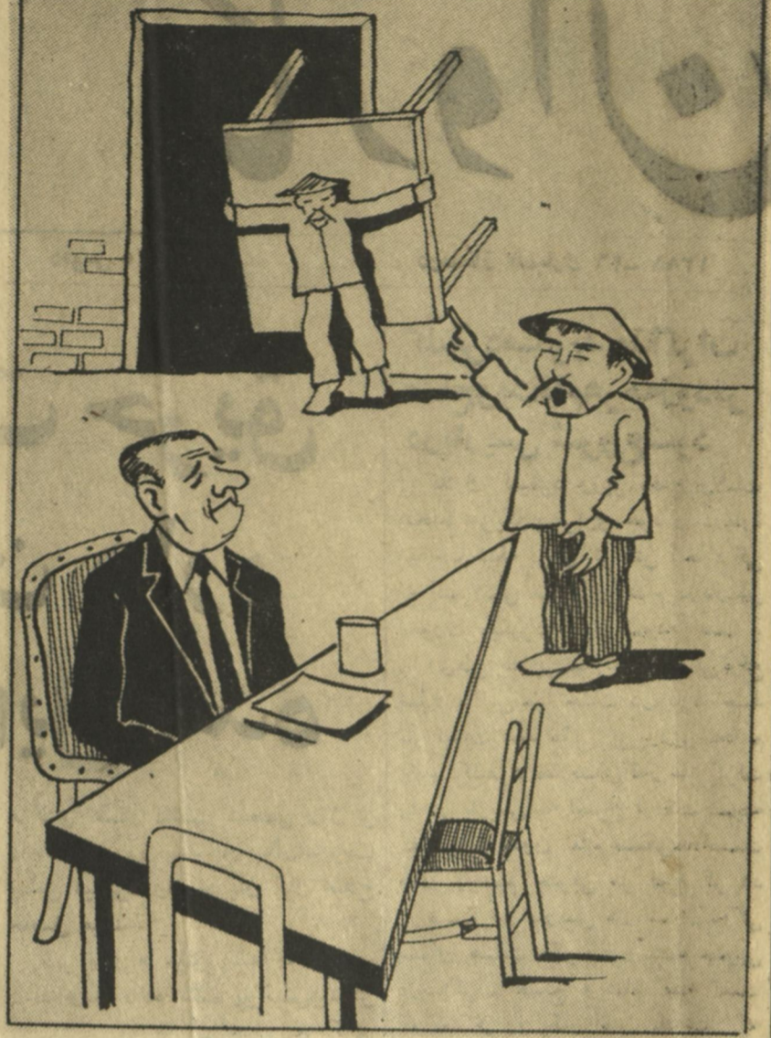
بیا در مثلث خوده وردار که مرعب آوردیم !