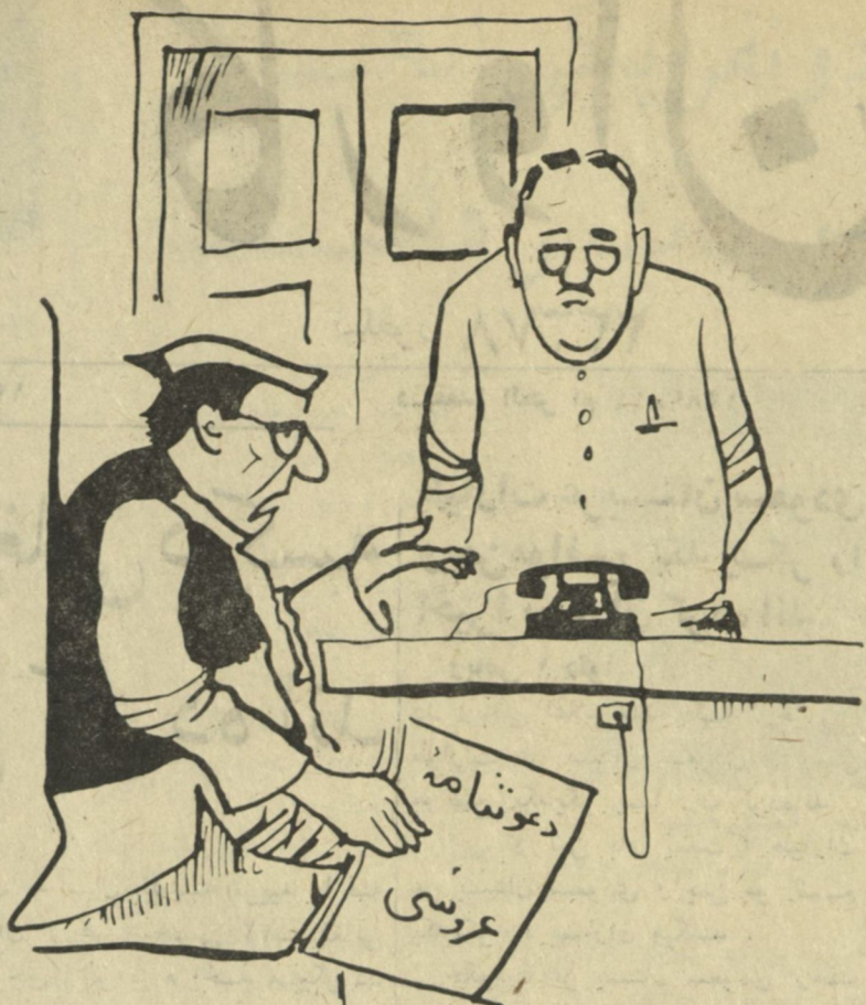
آمر صاحب مثلکه بسیار خسته می باشید؟ بلی، از دست اینقدر مجالس رسمی پدر آدم خسته می شود! (از منابع هندی)

این طبیب المانی چهار گروه خون را معرفی کرده: ای، بی، وای، بی. مثلا خون گروه ای را با بی نمیتوان مخلوط کرد و یا از خون گروه ای به بی نمیتوان تزریق نمود. اگر این دو خون را با هم مخلوط کنند دانه های بسته شده فوراوانی در خون بوجود می آید اگر خون گروه ای را در شش یا ششخص زنده که دارای خون گروه بی باشد تزریق کنند. جری خون متوقف میشود. از آن به بعد گروه های دیگر خون چون ام، وان، و با لا خره غایب آراچ، کشف شد که ممکن است آراچ مثبت یا منفی چنانچه اگر یک مرد با خون آراچ منفی ازدواج کند چه عواقب خطرناک و مرمک های پی در پی برای اطفال آنان پیش خواهد آمد.