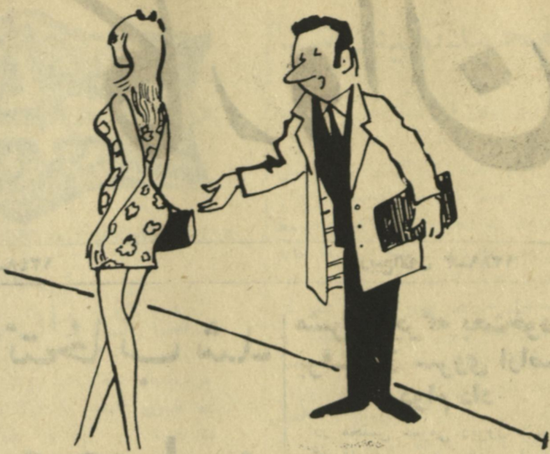
شیر اداره و روبه بیرون

با احترام محمد قاسم عارفی کراهه کابل تهران زیاد است بنا علی مدیر! در شماره ۲۸ حمل روز نامه کاروان این اعلان که عنقریب سر ویس زمینی بین کابل و اروا بر قرار خواهد شد توجه مرا بخود جلب نمود. در حالیکه شرکت قادری یا سر ویس می تواند خود شان مستقیما در زمینه اقدام نمایند، دیگر لزومی نخواهد داشت که ابتکار عمل را به دست یک شرکت دیگر بدهند اگر برای مو صوف شرکت قادری و یا