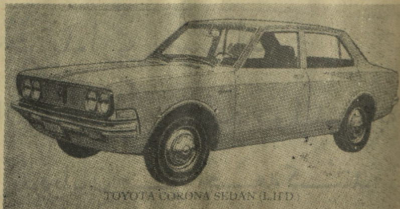
TOYOTA CORONA SEDAN (LTD)

مادل های جدید مو تر های تویوتا تازه رسیده مرجع : میروز سر ویس شهاب الدین میدان تلفون ۳۱۴۷۹