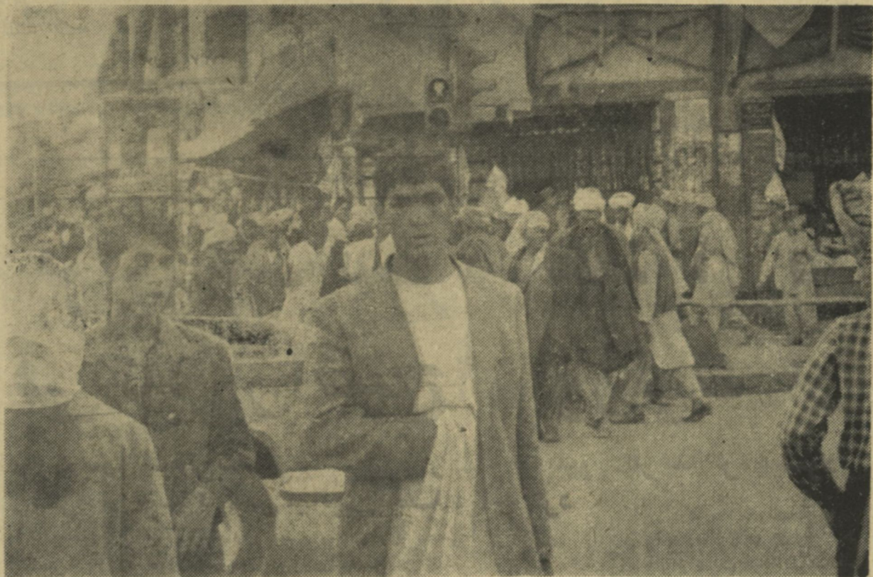
باوجود اینکه چراغ ترافیک سرخ است عابرین از سړک می گذرنه و در اکثر موارد پولیس ترافیک هم حاضر می باشد.