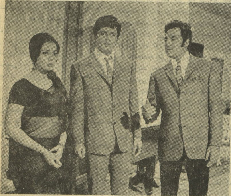
عالیترین فلم رنگه هندی بنام (اوباسنا) به اشتراک سنجی، ممتاز، فیروزخان، انور حسین، هلن . اوقات نمایش ساعت دو، پنج و هشت و نیم شب .