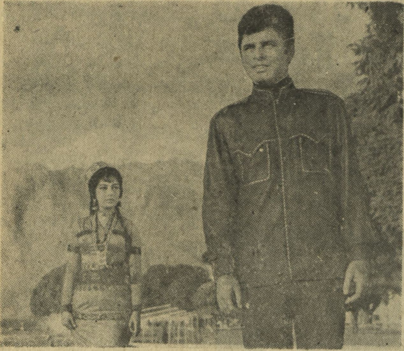
فلم سرپارنگه هندی بنام «اکبول دومانی» با شترک هنر مندانه هند سنجی - سادنا، باراج نانی، شبام-کمار برای آخرین بار نمایش داده میشود. اوقات نمایش ساعت ۲-۵ و ۸-شب.