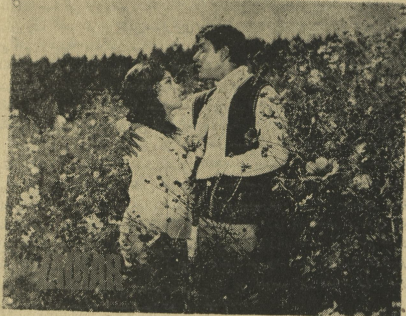
فر دا در سینما بهارستان فلم معروف هندی بنام لکار محصول یک کهنی پر قدرت و بزرگ سینمای رنگه هند نمایش داده میشود. درین فلم معروفترین هنریشان سینمای هند راجندر کمار، مالا سنیا، کم کم، دهر مندر، نذیر حسین، سنجیت کمار، دارا سنگ و آغا اشتراک دارند. اوقات نمایش ساعت دو نیم، پنج و نیم و هشت و نیم شب. نمبر تیلیفون ۳۲۶۰۸

سینما بهارستان که جدیداً افتتاح گردیده تقدیم میکند.