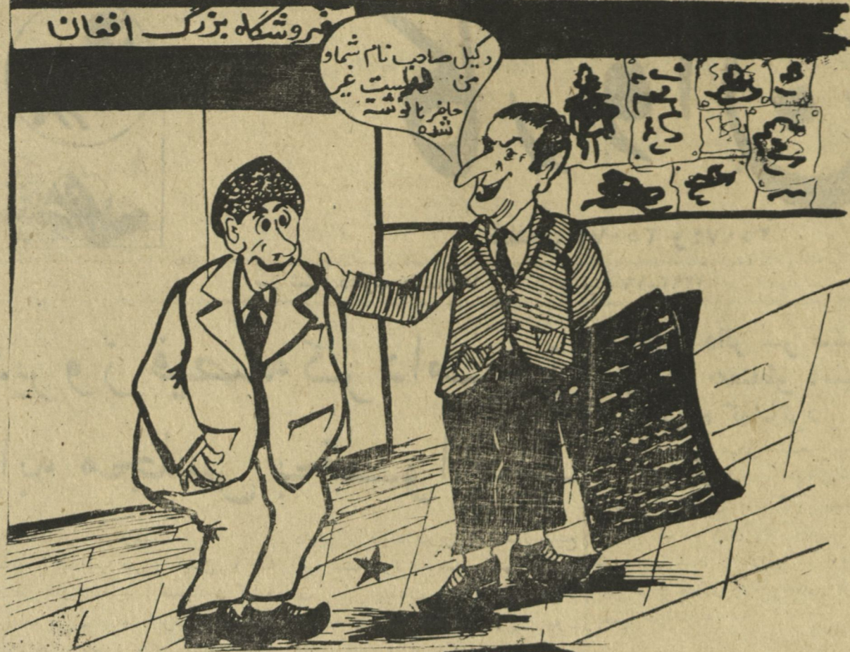
بدون شرح (کاروان)