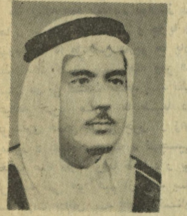
بنی غلی الزید پادشاه افغانستان بمناسبت سبت روزهای ملی و مذاکره به نمایندگی اعضای کور دیپلوما تیک در صورت خواش آنها میباشد.

وی گفت در جمله وظایف شیخ السفرا اجرای مراسم تدفین با سفرا، ترتیب دعوتها به افتخار سفرای مذکور از طرف کور دیپلوماتی، تقدیم تعارفات اعضای کور دیپلوما تیک بحضور اعلیحضرت