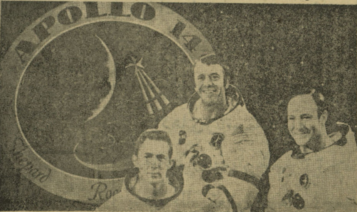
فضانوردان آپولو-۱۴ از چپ بر است ستوارت روزا پیلوت مدل فرماندهی شپرد فرمانده آپولو-۱۴ و ادگار میچل پیلوت مدل ماه نشین

سر نشینان سفینه آپولو-۱۴ امریکا که روز یکشنبه ۱۱ دلو عازم کره ماه میشوند با ایجاد یک سلسله انفجار های خفیف در سطح ماه ، در باره شکل ، ساختمان ، ضخامت و سایر خصوصیات قشر خار جی ماه مطالعاتی انجام میدهند . با ضبط امواجی که از این انفجار ها تولید میشود و بر رسی و مطالعه وضع آنها ممکن است اثری از وجود آب یا عدم آن در ماه کشف شود . ضمناً از روی اطلاعات حاصله ممکن است معلوم گردد که آیا ماه دارای هسته داغ گداخته ای بوده است یا خیر ؟ فر ما ندهی آپولو-۱۴ که از پایگاه کیپ کندی در ولایت فلو ریدا به فضا پر تاب میشود بهمه الی شپرد فضا نورد معروف است و همراهان او عبارتند از: «ادگار میچل» و ستوارت روزا که اولی پیلوت مدل ماه