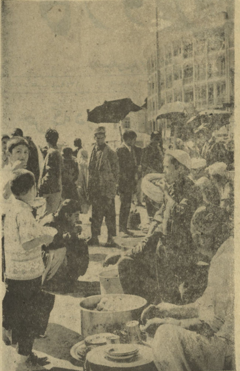
یک منظره از خیابان های کابل که در مقابل پستی تجار تسی