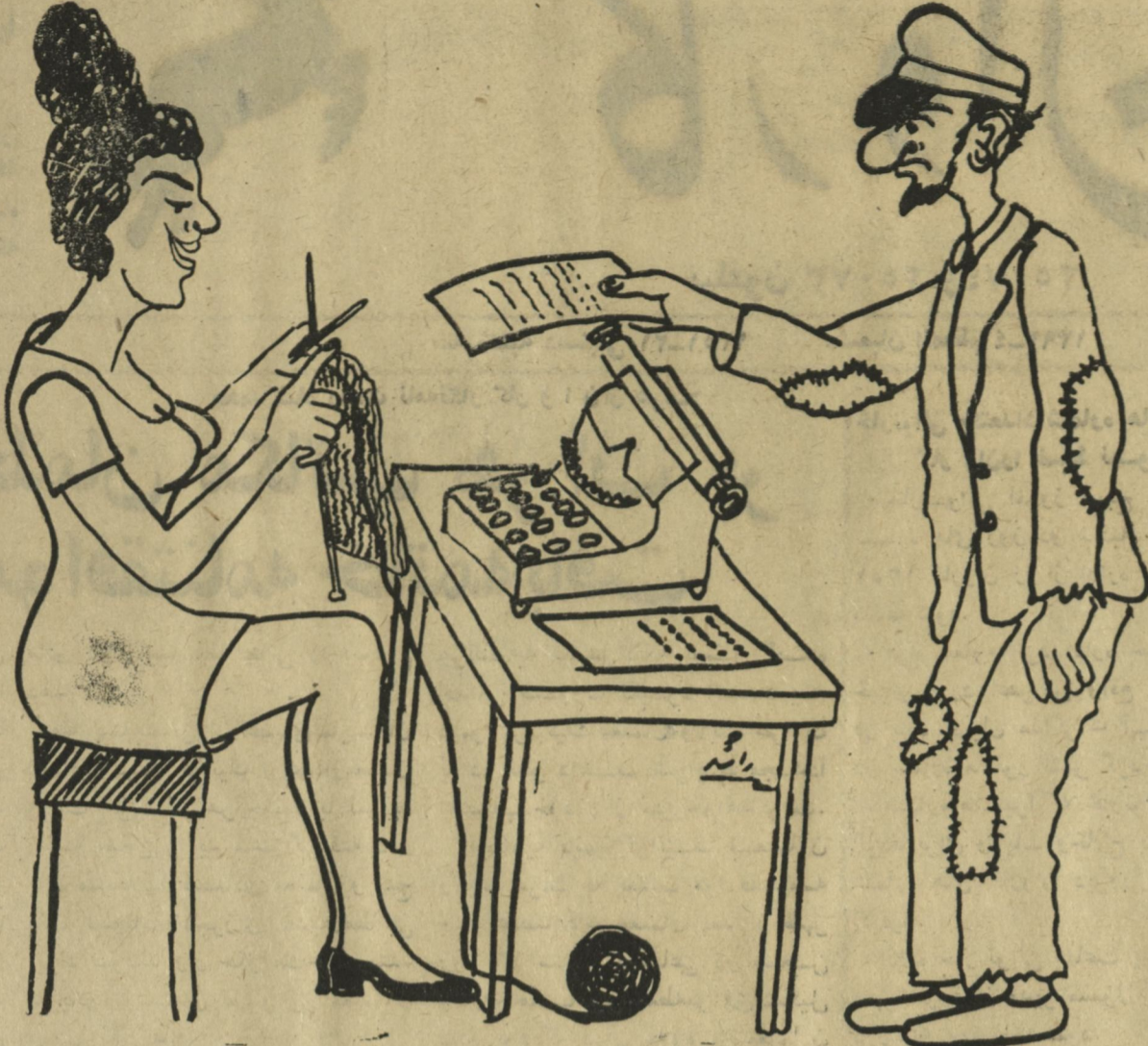
پیاده - همشیره جان مدیر صاحبگفت که این مکتوب را فوری تا پیک کنید ناپیست - بگذارش روی میز مگر کور هستی، نمی بینی که من هم کار ضروری دارم

احوال و صنایع وطنی را بجای احوال خارجی استعمال نماید، اگر سرمایه دار است به عوض آنکه سرمایه خود را عاطل نگهدارد یا به مسافرت خانه سازی سوق دهد، برای انکشاف صنایع مورد احتیاج مردم بکار اندازد و ازین راه برای خود و مملکت مفید واقع شده از صرف اسعار خارجی جلوگیری نماید. از جانب دیگر بر حکومت است که بدقت تمام عایدات ملی را برای بهبود مردم به صرف رسانیده در انتخاب پروژه ها و پلان سازی ها دقت زیاد اجرائی و تخنیک را بکار برد.