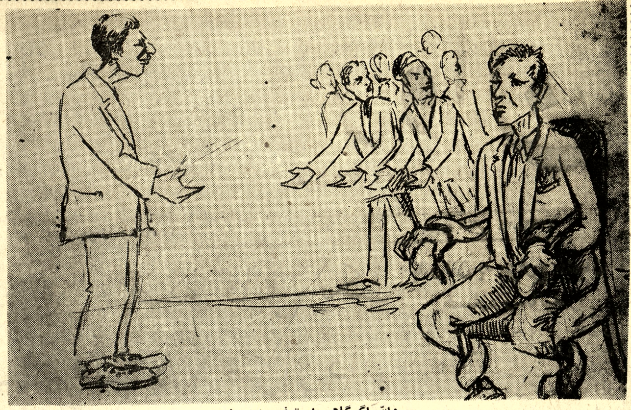
والله اگر گاهی استغفی بدم ! (کاروان)

این سیمینارها از نظر علمی و تیوریک خوب است اما از نظر عملی دردهای خاص ما را چندان دوا کرده نمیتواند. ما باید مسایل اساسی معلمان نه تنها از معلمان بلکه از تمام مملکت را مطرح نموده درصدد علاج آنها برآیم و این را هم بدانیم که خارجیان مشکلات کار ما را چندان نمی دانند.